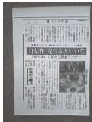
↑ 毎日新聞2005年1月24日23面