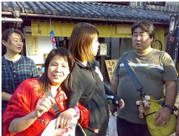
↑ 一泊旅行（自由時間）